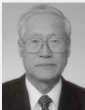
3年C組担任・英語・進学係