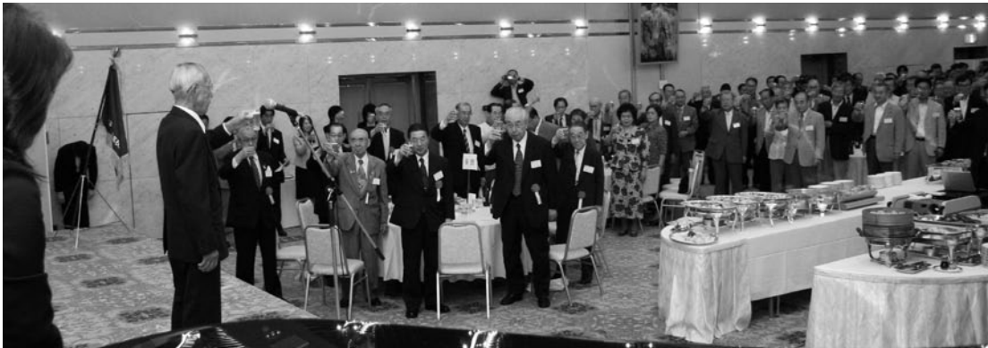
第41回東京同窓会(アルカディア市ヶ谷)より