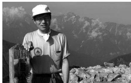
北アルプス唐松岳への山岳パトロール

三大奇祭「諏訪大社御柱祭」が開催されます。また、来年10月~12月には、JRグループとの連携による大型観光キャンペーン「信州 destination キャンペーン」が実施され、新型リゾートトレインがJR大糸線をメインに走行します。現在、JR東日本でハイブリッド型のリゾート車両を新造中です。