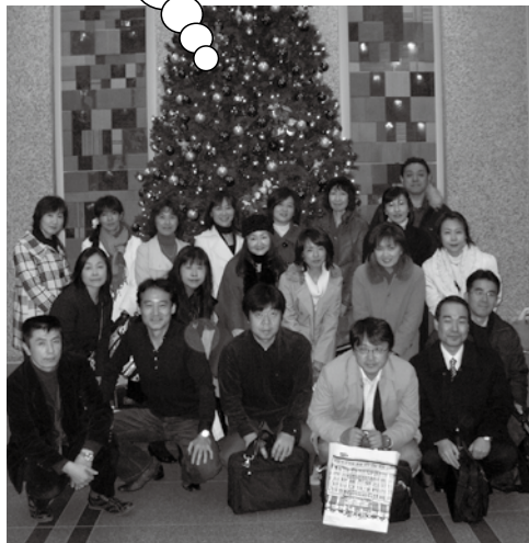
31期やまびこ会・実行委員会メンバー 2008年12月20日