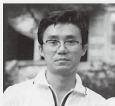
3年H組担任・数学・旧職員

ことを学び、考え、そして活動しながら将来への力をしっかりと育んでくれる時期でもあります。県陵で、一番輝ける時期に出会った友と、いろんな事を感じ経験してそれぞれ一人ひとりに忘れることのできないドラマを作ってきた。そんな友との「出会い」をいつまでも大切にして人生の糧となることを願っています。私にとっても、県陵での八年間とそこでの生徒との出会い