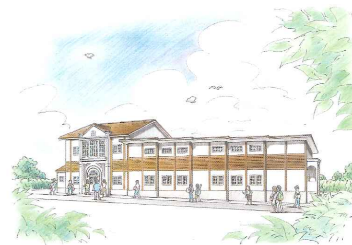
イメージ図(入口は、旧本館を模しています。)