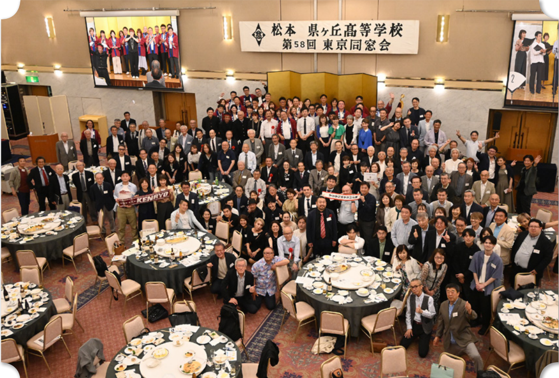
2025年6月14日(土) 大集合した縣陵東京同窓会 総会・懇親会 アルカディア市ヶ谷にて