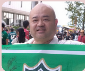
母校愛のリレー48回生代表

ますのご健勝、ご多幸を心より祈念いたしますとともに、引き続き母校への変わらぬ温かいご支援、ご高配を賜りますようお願い申し上げます。 腰原先生は4月から長野県教育委員会事務局高校教育課に異動されました。