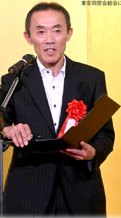
2025年6月7日(土) 東京同窓会総会にて

今年度はこの企画をバージョンアップし、3月6日(金)に本校及び松本深志、松本蟻ヶ崎、松本美須々ヶ丘、東京都市大塩尻5校の1年生約1,400名による「春の探究まつり2026」を開催するべく現在企画を進めています。会場も前回は本校だけでしたが、今回