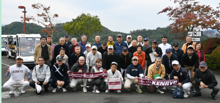
2025年(令和7年)10月23日(木)第93回アルペン会ゴルフコンペ 参加者全員スタート前の余裕の笑顔。上野原カントリークラブにて

天候不順等のアクシデントが無ければ令和11年春季にアルペン会は第百回を迎えます。私は米寿の前年となりますがそれへの参加を目指して健康でありたいと思います。改めて幹事の方々に謝意を表しますと共にアルペン会がこれからも永く続くために新たな、そして多くの方の参加をお願い致します。