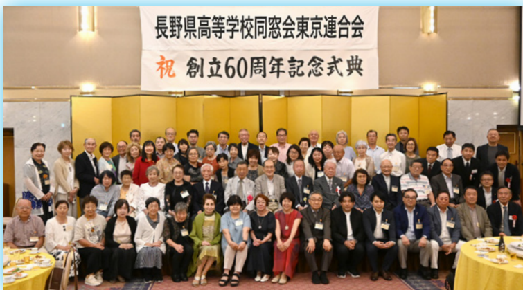
上) 2025年(令和7年)7月5日(土) 東京同窓連定期総会に集合した、中信同窓連の面々。 右下) 2024年(令和6年)9月30日、中信同窓連 親睦旅行会、小田原城にて。

中信同窓連は、松本蟻ヶ崎高校、松商学園、松本深志高校など約10校の同窓会から組織されています。会員の年齢層は幅広いですが、年代や高校は違っても同じ郷里で過ごした3年間の想い出が共通とな