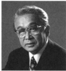
松本県ヶ丘高等学校同窓会