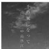
「千の風になって」(株)ピュアハーツ ¥2000税込み HMCC-1002 「アメイジング・グレイス」他 6曲収録